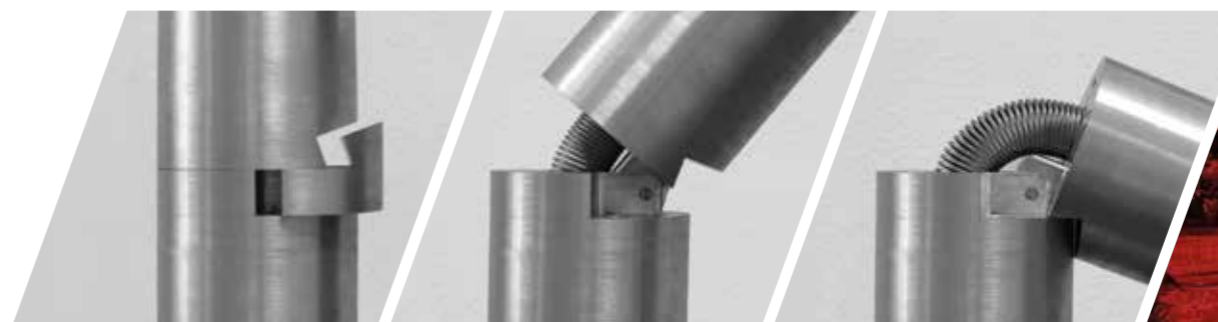
Kippmechanismus mit Keil